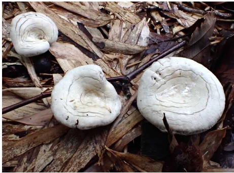
ムツノウラベニタケ