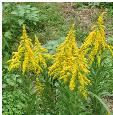
セイタカアワダチソウ