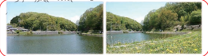
ここからお楽しみください！ 鳥谷池と獄山の風景

東畑みんなの元気塾へは… ・「くるりんバス」が便利です、【東畑口】下車・徒歩1分 ・「奈良交通バス」の場合、【光台八丁目(東光小学校前)】下車・徒歩約10分 住所：精華町東畑荒内45番地1 電話：0774-51-0958 Eメール：genkijuku@kcn.jp 開館時間：月～金曜日の午前9時～午後5時