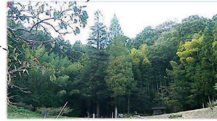
わくわく獄山広場のメタセコイア