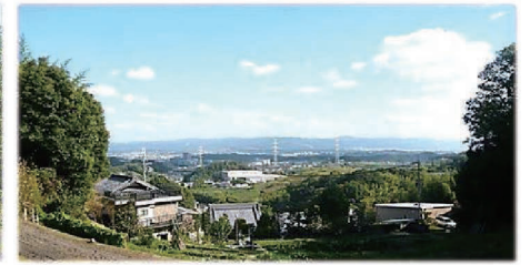
わくわく獄山広場からの眺め